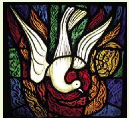
Vitrail Foyer St Jacques à Laval