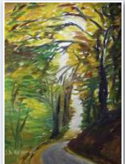
Tableau peint par le Père Jean Le Rétif