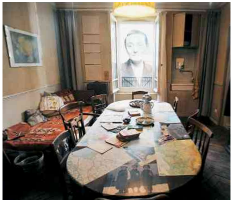
Table de travail de Madeleine Delbrêl

Madeleine mourut le 13 octobre 1964 et repose dans le cimetière d'Ivry sur Seine . Elle est déclarée vénérable depuis 2018 .