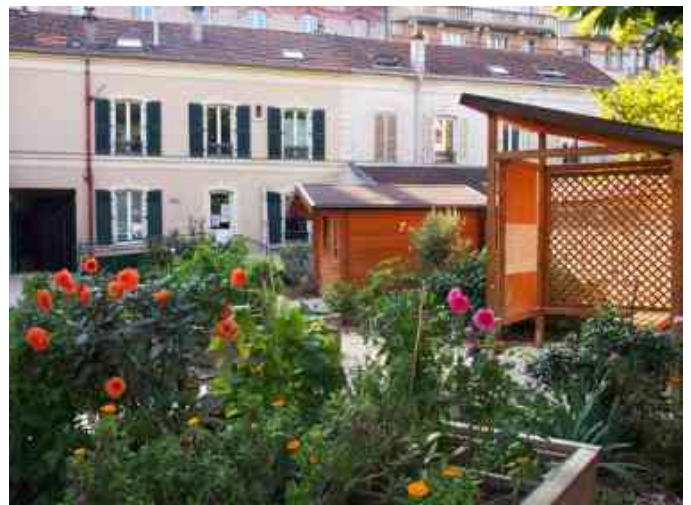
La maison rénovée de M.D. aujourd'hui

Oui, deux heures consacrées à la prière quotidienne (Eucharistie comprise) et chaque semaine, son équipe se réunissait, partageait autour de l'Évangile . Elles y invitaient aussi le voisinage, la Parole de Dieu ayant une importance capitale pour elles. Cela, bien avant le concile Vatican II. Elles étaient pionnières, en ce sens. Elles n'auraient d'ailleurs, pas tenu le coup sans la prière.